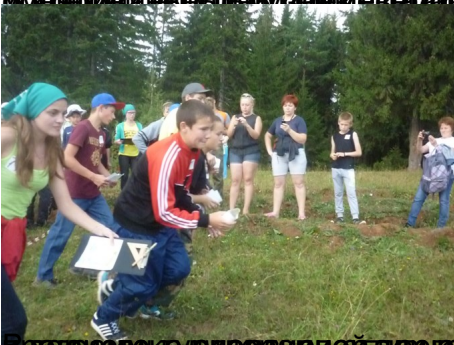
вводного урока для учащихся 5-7 классов. Вводный урок по теме "Краеведение" в 5-м классе. Вводный урок по теме "Краеведение" в 5-м классе.