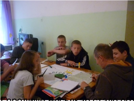
...ектом конкурсного описания.