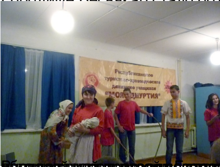
Удмуртский республиканский конкурс краеведов и этнографов. Близость с