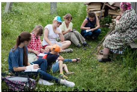
Презентация проекта «Молодёжь в науку» в рамках работы районного Центра культуры и досуга «Солнышко».